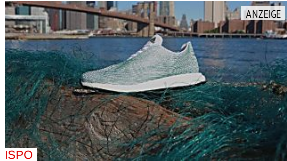
ISPO Nachhaltig: Der Müll-Schuh von Adidas