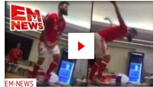
EM-NEWS Wales-Star dreht durch der verrückteste Tanz der EM