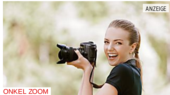
ONKEL ZOOM Suchst du die perfekte Kamera?