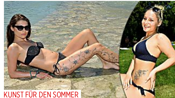
KUNST FÜR DEN SOMMER BILD zeigt die neuen Tattoo-Trends